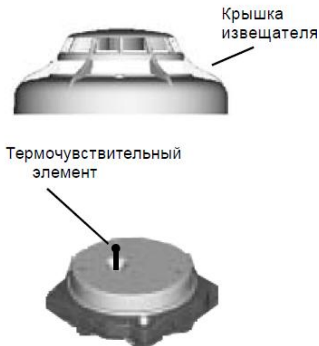
Рис. 2. Извещатель ИП101-23М-А1R со снятой крышкой